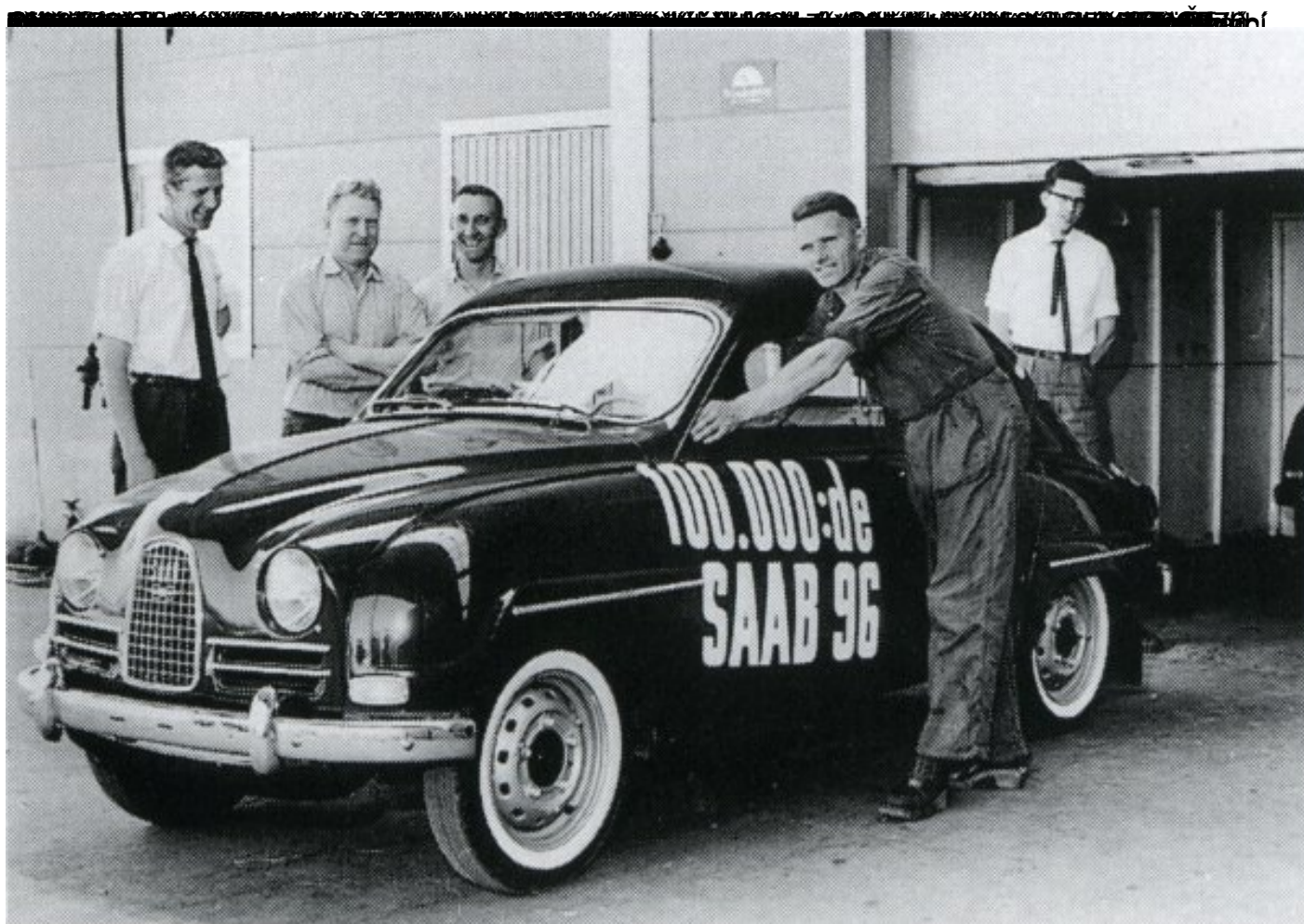
Saab 96 a 96/5